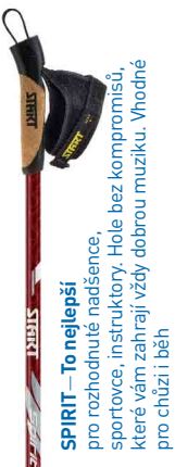
SPIRIT – To nejlepší

pro rozhodnuté nadšence, sportovce, instruktory. Hole bez kompromisů, které vám zahrají vždy dobrou muziku. Vhodné pro chůzi i běh