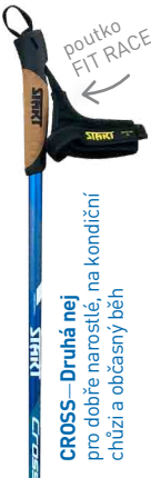
CROSS – Druhá nej

pro rozhodnuté nadšence, sportovce, instruktory. Hole bez kompromisů, které vám zahrají vždy dobrou muziku. Vhodné pro chůzi i běh