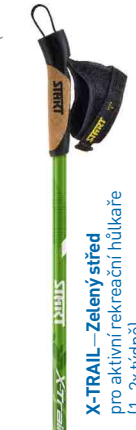
X-TRAIL – Zelený střed

pro dobře narostlé, na kondiční chůzi a občasný běh