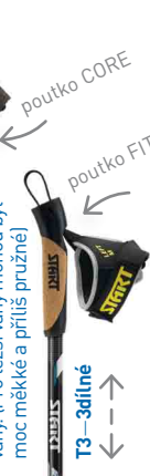
T3 – 3dílné

pro rekreační hůlkaře a lehké váhy. (Pro těžší váhy mohou být moc měkké a příliš pružné)